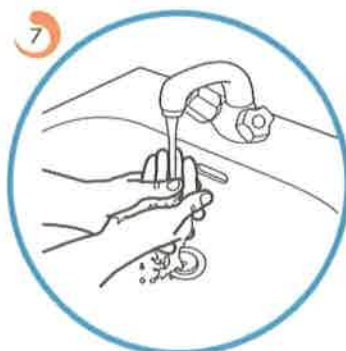
Roke si temeljito speremo pod vodo.