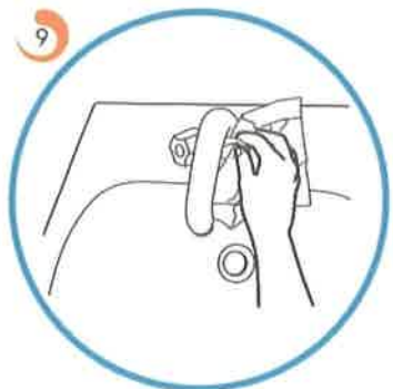
S papirnato brisačo zapremo pipo.