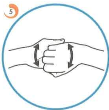
Drgnemo konice prstov vsake roke.