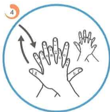
Umivamo med prsti.