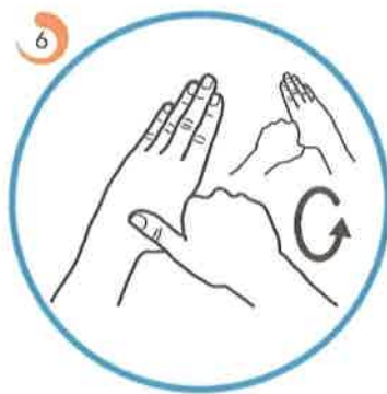
Umivamo vsako zapestje posebej.